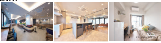
【仲介】損害保険個別加入必須 ※取引有効期限 2024年9月30日