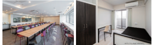
【仲介】損害保険個別加入必須 ※取引有効期限 2024年9月30日