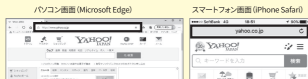
【上図の黒枠内にURLをご入力ください】

Q URL「https://」から始まるECサイトアドレスを正しく入力してもECサイトにアクセスできません。 URLを正しい箇所にご入力いただいているか、以下をご参照いただきご確認ください。